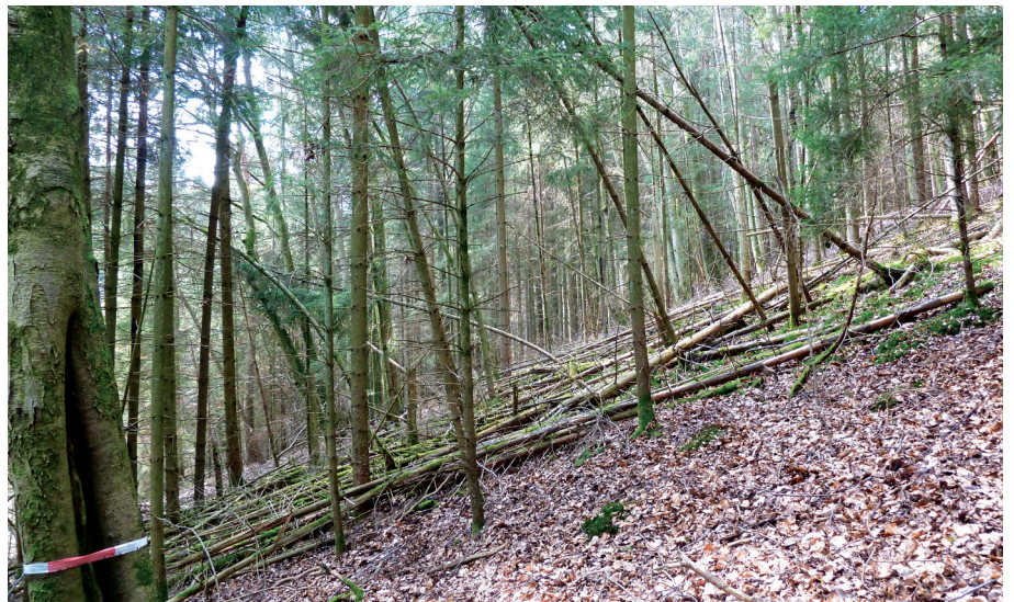
Die durch neueste Gesetzgebung vorgegebene Mindernutzung des Waldes stellt eine Diskrepanz zwischen der aktuellen Verwertung, den künftigen Notwendigkeiten im Energiesystem sowie der gesetzgeberischen Realität dar

Der größte Teil der erneuerbaren Energie über alle Sektoren hinweg stammt mit einem Anteil von 58,8 % aus Biomasse [5]. Ungefähr die Hälfte des Beitrags der Biomasse entfällt auf die biogenen Festbrennstoffe inkl. Klär-